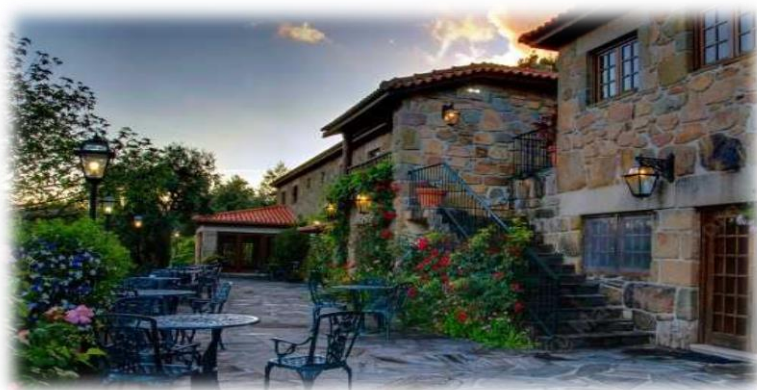
Quinta das Escomoeiras